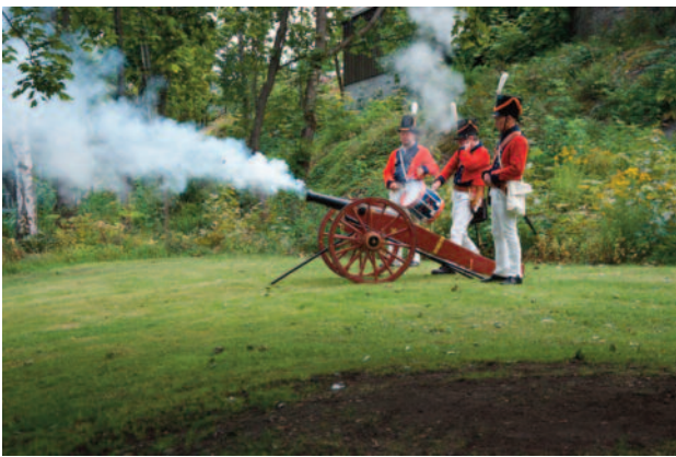
Salutt for dagen

I 1399 var det et saltkokeri ved fossen. Fossen ble først benyttet til kverndrift. To av landets første vandrevne sager var her, og det ble sagbruk om dagen og møller om natta. På det meste var det 50 sagbruk som brukte kraften fra fossen. Da snakker vi helt tilbake til 1630-tallet.